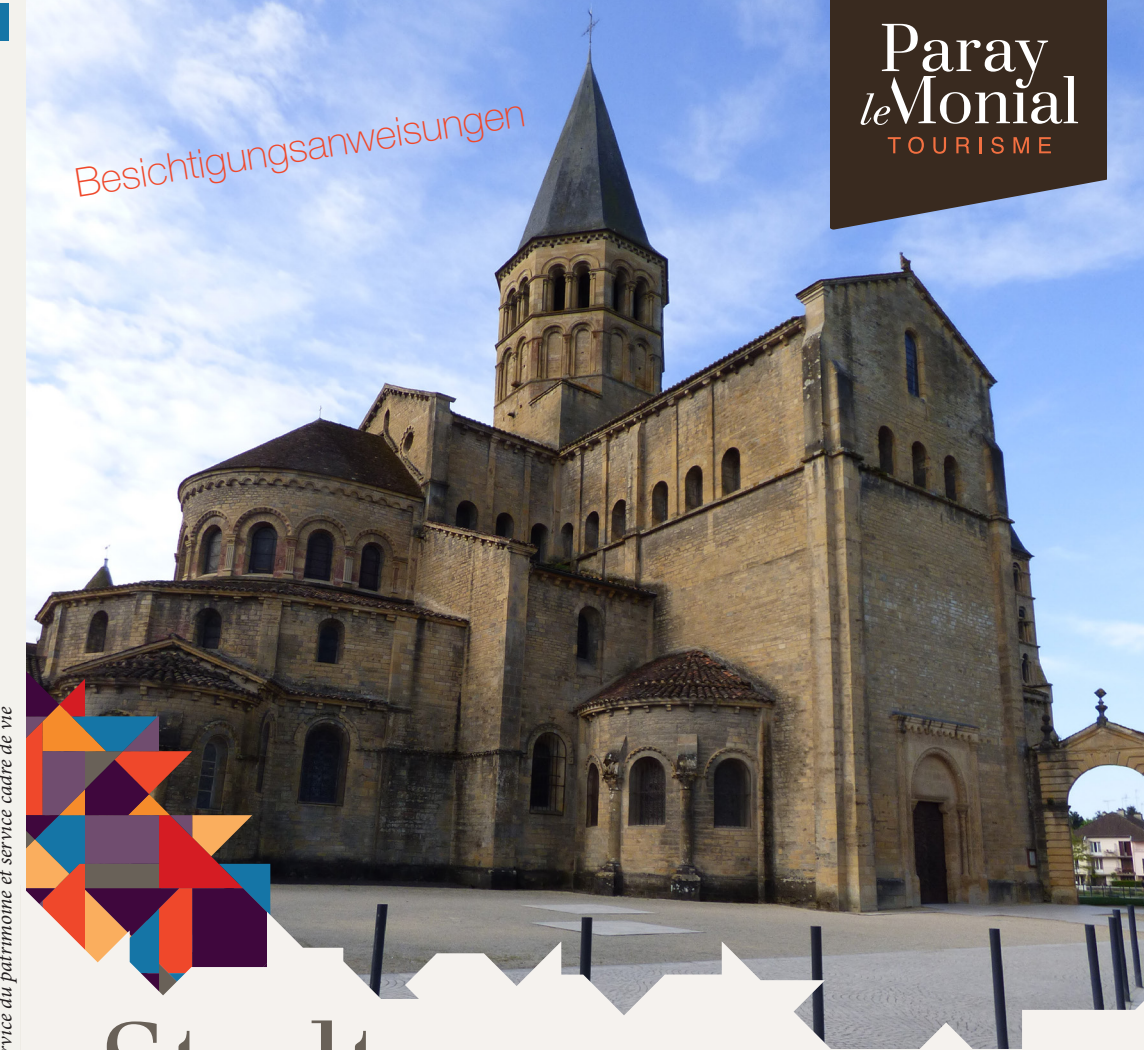
Réalisation office de tourisme. Sources : service du patrimoine et service cadre de vie